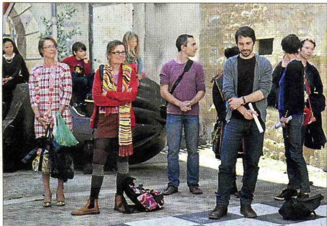
■ Cette année, les artistes accompagnent leurs œuvres.