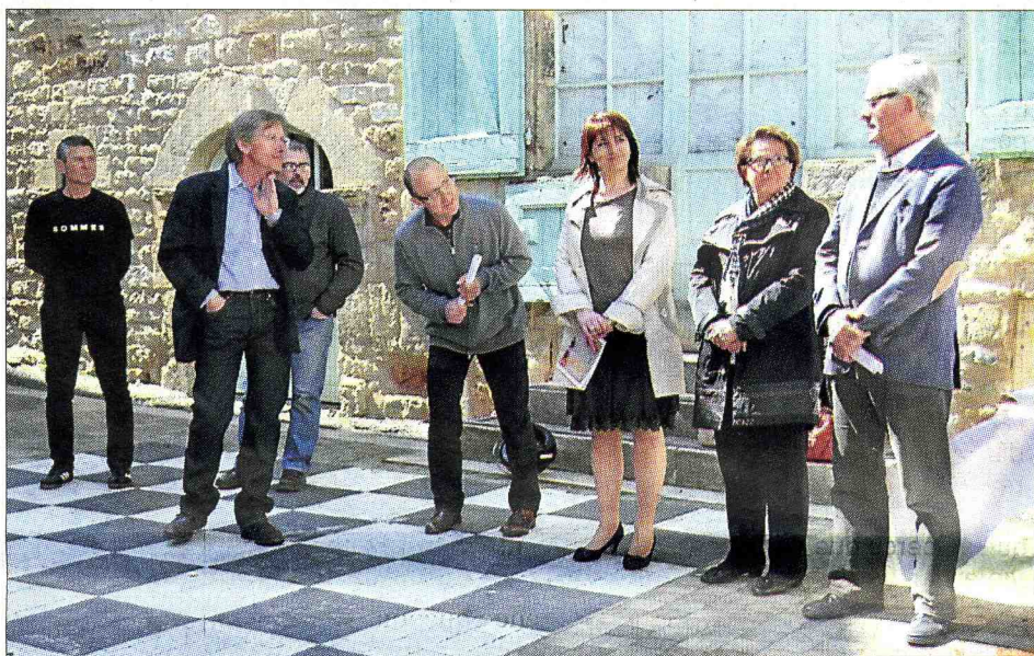
■ Une nouvelle dynamique d'échanges entre la ville de Mende et les artistes.